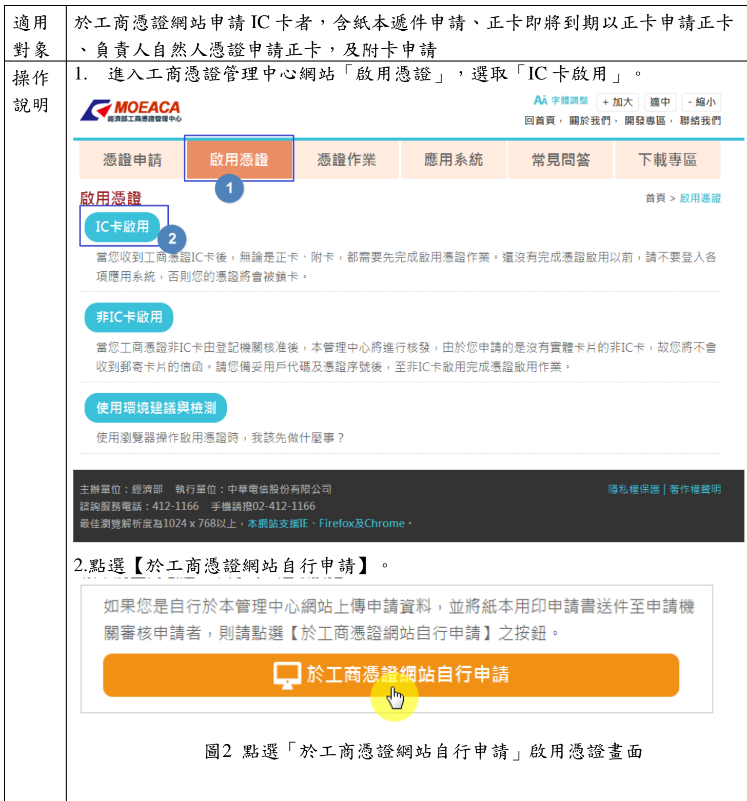
圖2 點選「於工商憑證網站自行申請」啟用憑證畫面