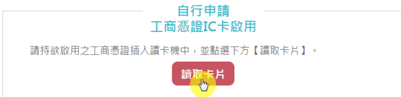
圖3 「於工商憑證網站自行申請」讀取卡片畫面