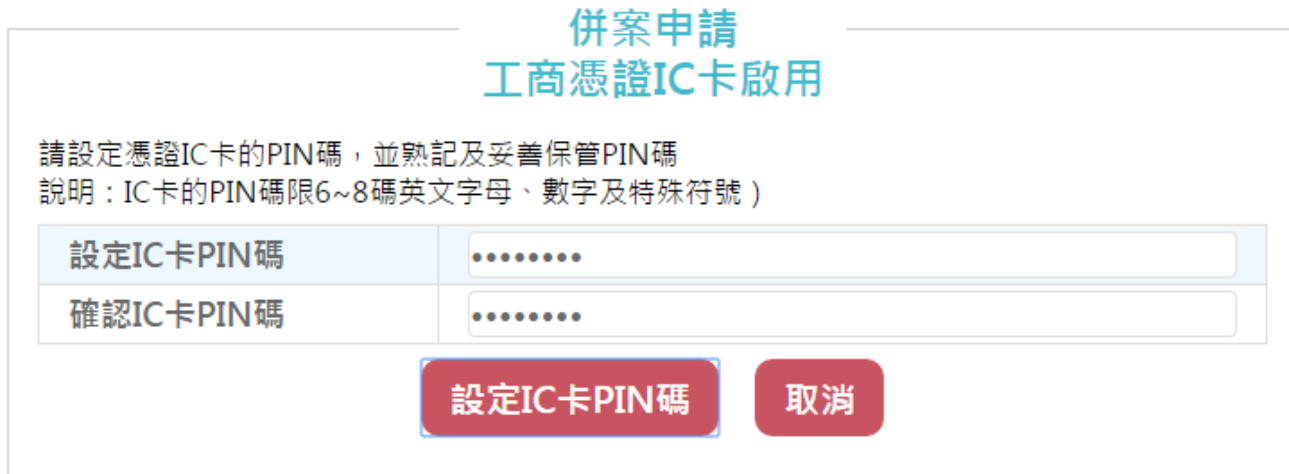
圖10 「透過登記機關之公司或商業『設立/變更登記表』併案申請工商憑證」設定 IC 卡 PIN 碼畫面