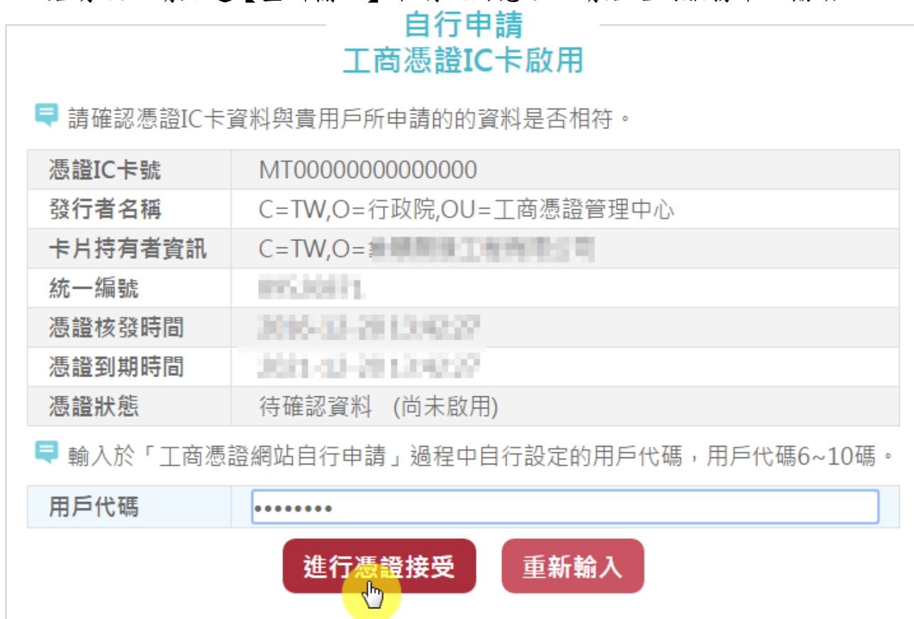
圖4 「於工商憑證網站自行申請」進行憑證接受畫面