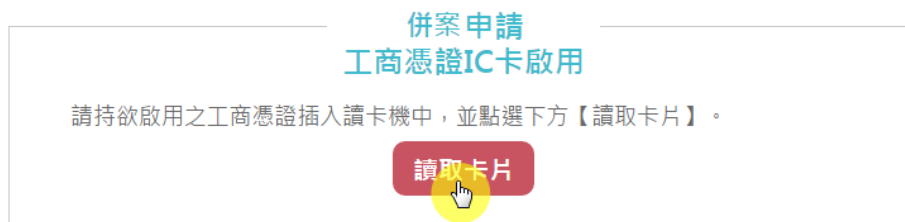
圖8 「透過登記機關之公司或商業『設立/變更登記表』併案申請工商憑證」讀取卡片資料畫面