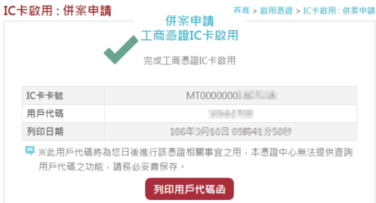
圖11 「透過登記機關之公司或商業『設立/變更登記表』併案申請工商憑證